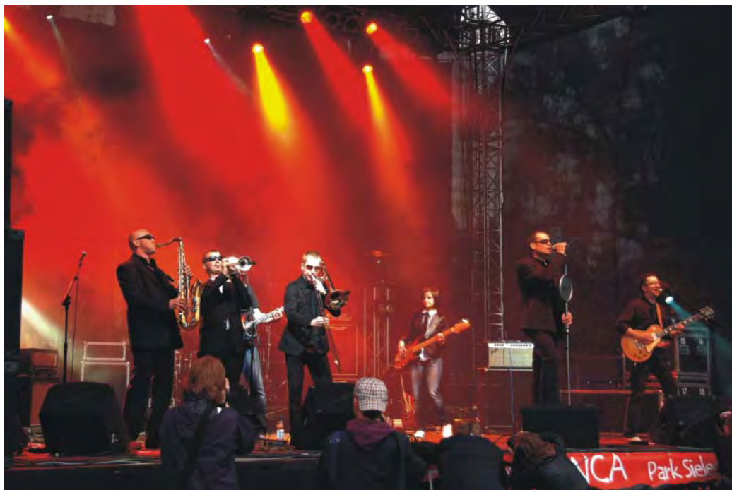
Dni Sosnowca 2009 - koncert zespołu Skankan