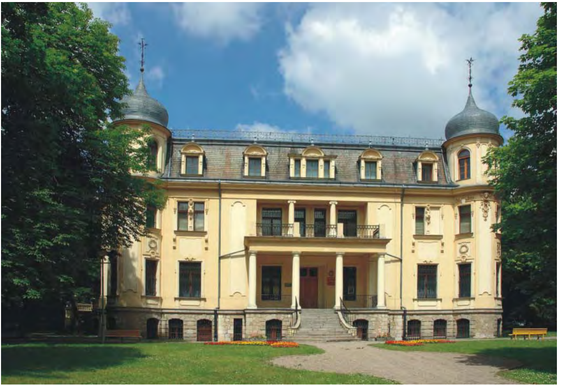
Muzeum w Sosnowcu