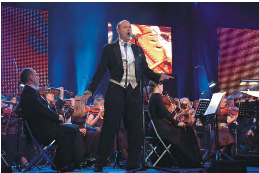
I Europejski Konkurs Tenorow 2009