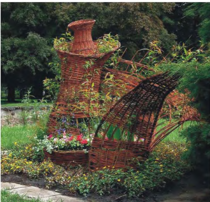
Rzeźba wiklinowa wykonana na warsztatach w Domu Kultury Maczki