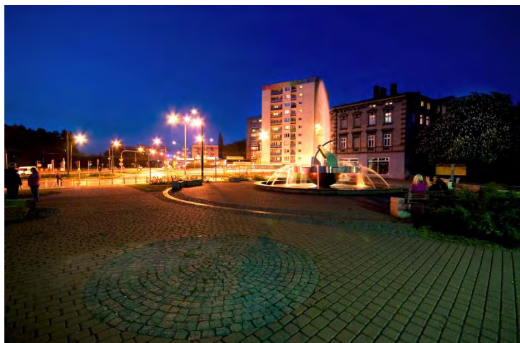
Plac Konstantego Ćwierka