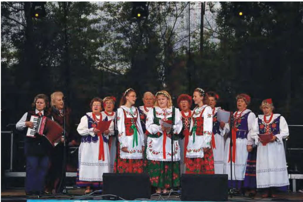
Zespół folklorystyczny Klimontowianki