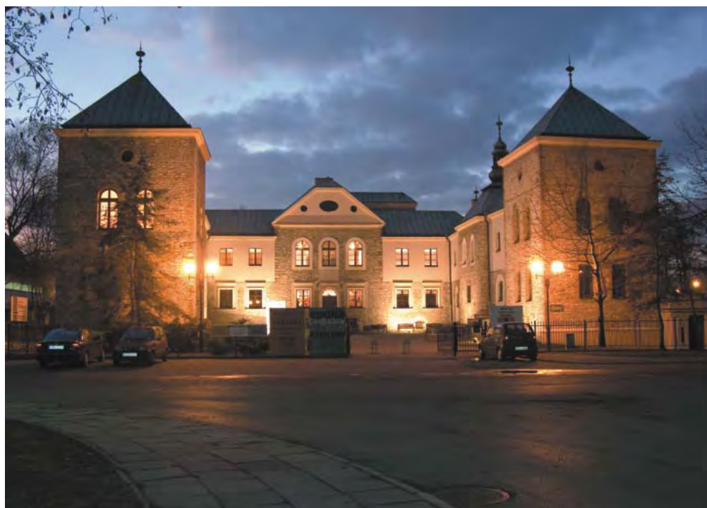
Sosnowieckie Centrum Sztuki