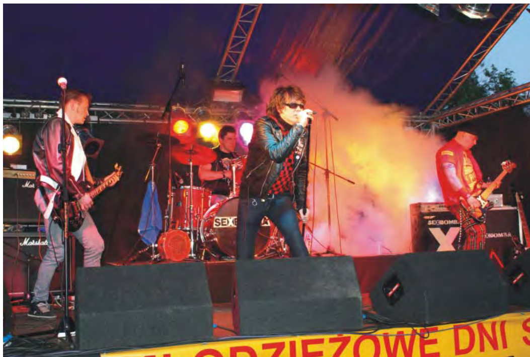
Młodzieżowe Dni Sosnowca