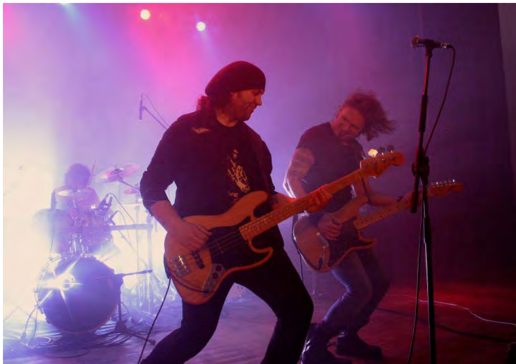
Koncert Zespołu Vintage