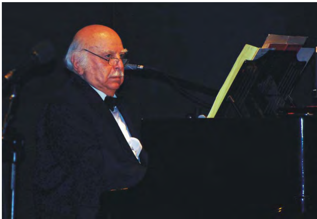
Koncert Leopolda Kozłowskiego